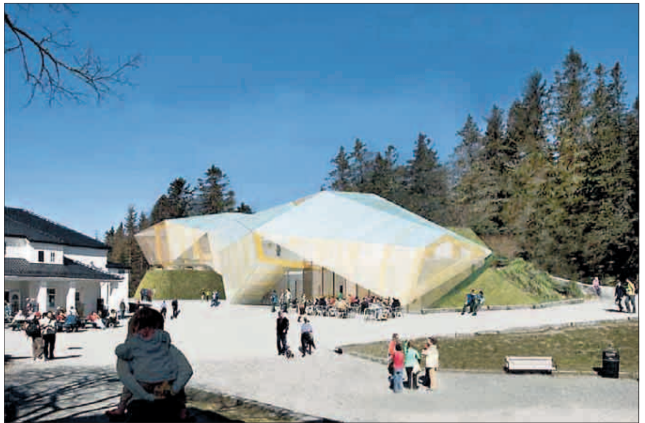
SETT FRA FLØYEN: Det nye opplevelsessenteret ligger liksom og bukker seg i haugen bak stasjonsbygningen på Fløyen.

TAPPEKRAN: I Kristiansund holder brannvesenet seg både med møtested og tappekran.